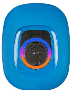
EV Charging Station NS