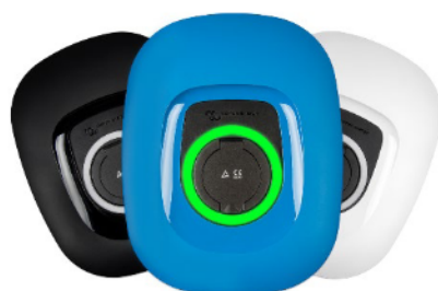
Schwarze, blaue (Standard) oder weiße Front