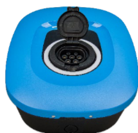
EV Charging Station NS - Front