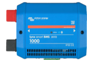
Lynx Smart BMS 1000A