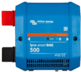
Lynx Smart BMS 500 A