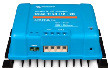
Orion-Tr 24/12-20 (240W)