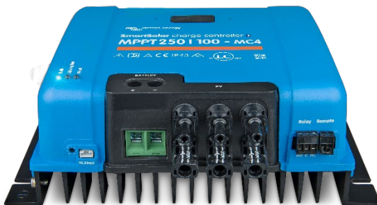
SmartSolar-Laderegler MPPT 250/100-MC4 ohne Display