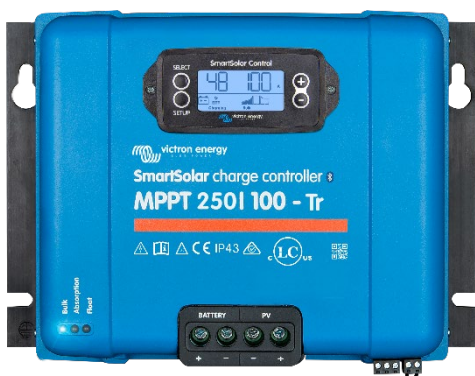
SmartSolar-Laderegler MPPT 250/100-Tr mit optionalem einsteckbarem Display